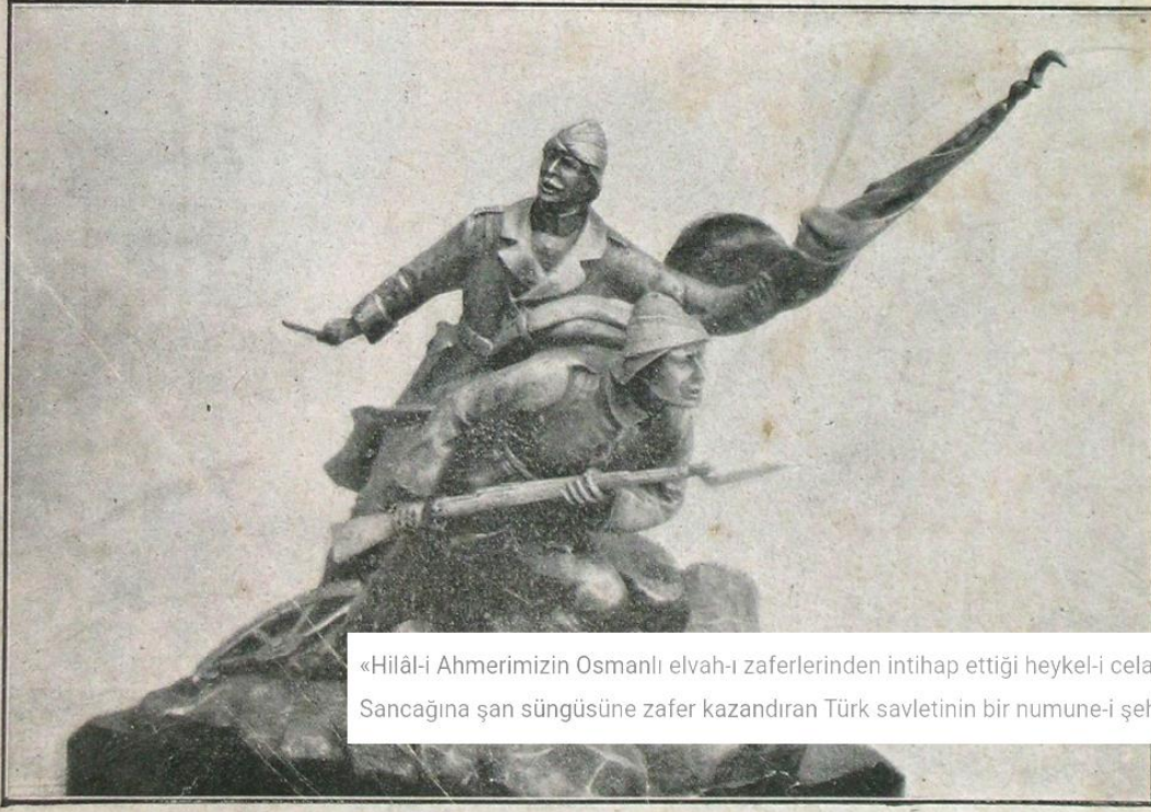
«Hilâl-i Ahmerimizin Osmanlı elvah-ı zaferlerinden intihap ettiği heykel-i celadetten» Sancağına şan süngüsüne zafer kazandıran Türk savletinin bir numune-i şehameti

« هلال احمدیك عثماني الواح ظفر لردن انتخاب ایشدیكى هیكل جلا دندن »